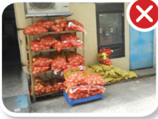
不恰当的食物存储方式 மோசமான உணவுப் பொருள் சேமிப்பு