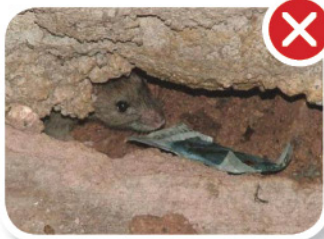
縫隙中的老鼠 பிளவில் உள்ள எலி