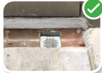
使用金属沟漏 உலோகத்தாலான கழிகாற்பொறியைப் பயன்படுத்தவும்