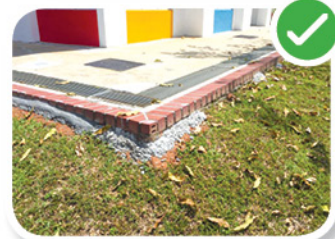
密封的裂缝 வலைப்பின்னலால் மூடப்பட்ட பிளவுகள்