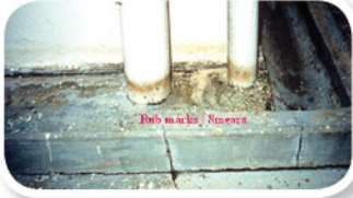
擦痕 எலி எச்சங்கள்