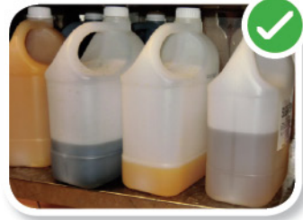
恰当的食物存储方式 சரியான உணவுப் பொருள் சேமிப்பு