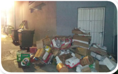
商店后面乱堆的杂物 கடைகளுக்குப் பின்னுள்ள இரைப்புகள்

□ ஏதேனும் எலி மொய்க்கும் தடங்கள் உள்ளதா என குறைந்தபட்சம் வாரம் ஒரு முறையாவது சேமிப்புப் பகுதிகளை சோதனையிடவும்.