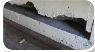
咬痕 கடித்த தடங்கள்