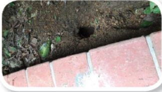
老鼠洞 எலி வளைகள்