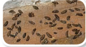
老鼠屎 தேய்த்த தடங்கள்